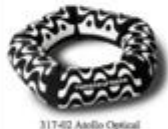
317-02 Atollo Optical