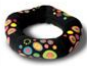
317-05 Atollo Anzi '60