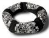
317-03 Atollo Graffi