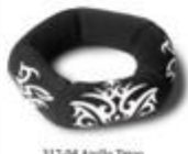
317-04 Atollo Tacco